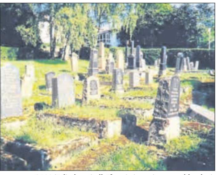
Insgesamt 2000 jüdische Friedhöfe existieren in Deutschland, einer davon liegt in Altwildungen.