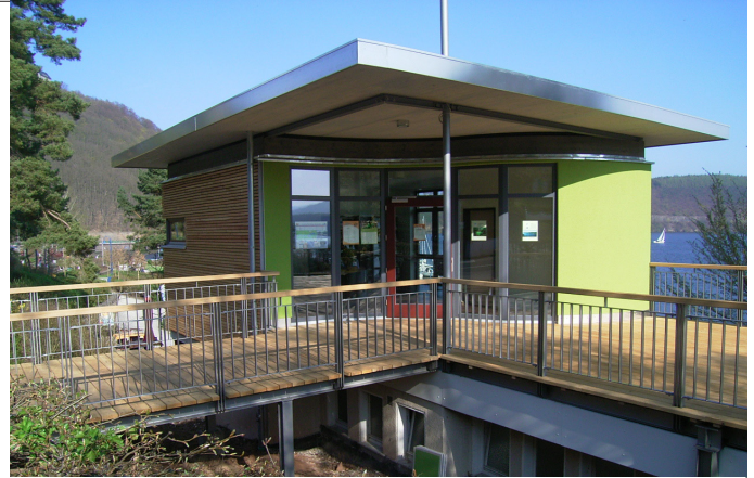
Entwurf Architekten Torsten Zimmer u. Antje Relke-Paul, Dipl.-Ing.